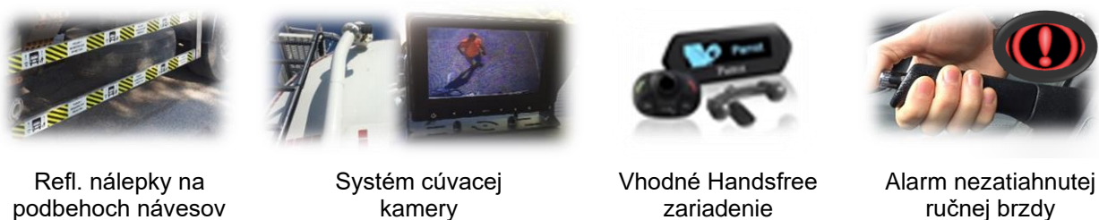
Refl. nálepky na podbehoch návesov